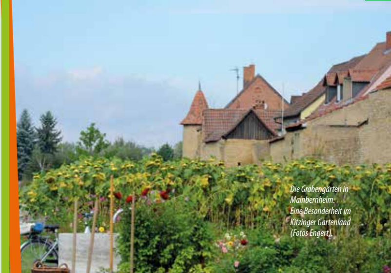
Die Grabengärten in Mainbernheim. Eine Besonderheit im Kitzinger Gartenland.