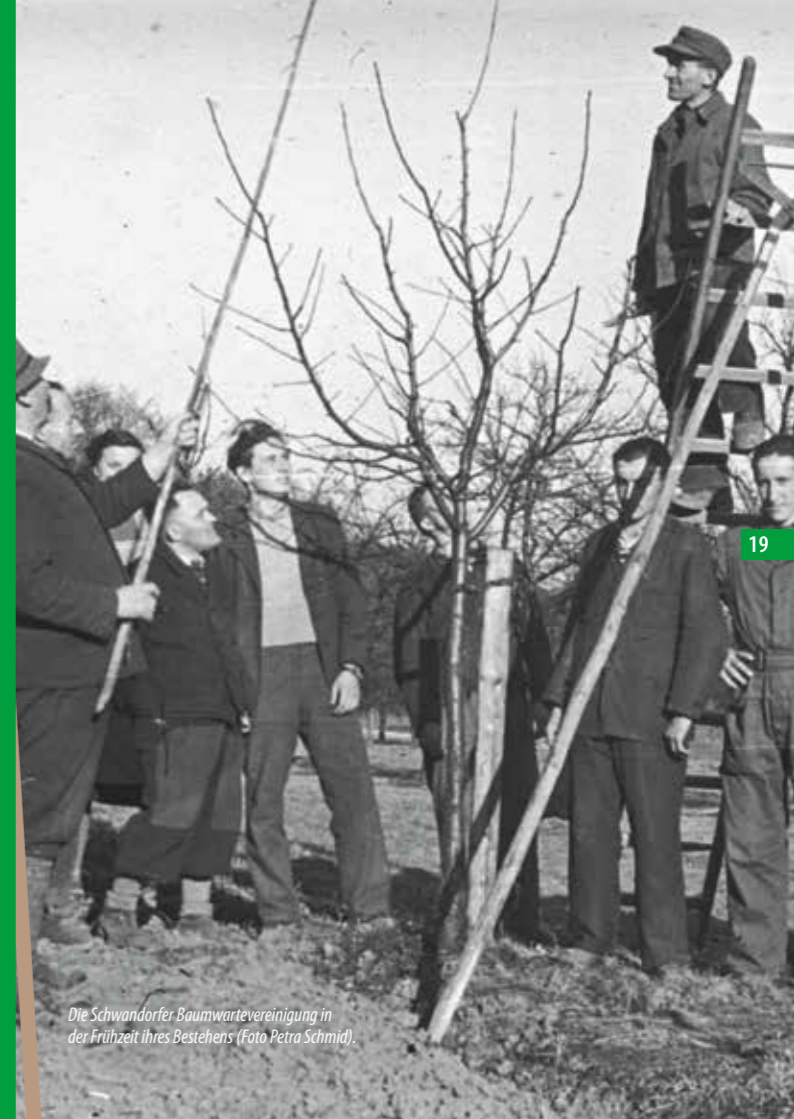
Die Schwandorfer Baumwartevereinigung in der Frühzeit ihres Bestehens.

Petra Schmid, Dipl.-Ing. agr. Univ., Kreisfachberaterin im Landkreis Schwandorf