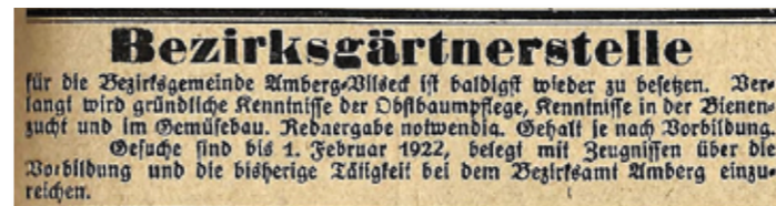
Regelmäßig erscheinen in der Zwischenkriegszeit im Organ des Bayerischen Landesverbands für Obst- und Gartenbau Anzeigen für neu zu besetzende Bezirksgärtnerstellen (Wegweiser für Obst- und Gartenbau 30, 1922, Nr. 18, S. 140).

Bezirksbaumwärter. Da Kreiswanderlehrer und Baumwärter nicht ausreichten, um die mehr als 150 bayerischen Bezirke mit obstbaulichem Wissen und Können zu versorgen, wurden ab 1900 zunehmend Bezirksbaumwärter eingestellt. In der Regel waren sie besser ausgebildet als die lokal tätigen Baumwärter, hatten eine Lehre in der Landwirtschaft oder im Gartenbau absolviert, einen mindestens einjährigen obstbaulichen Lehrgang besucht und praktische Erfahrungen gesammelt. Sie waren fachaufsichtlich den Kreiswanderlehrern unterstellt und beaufsichtigten ihrerseits die Arbeit der Gemeindebaumwärter. Ihre Hauptaufgaben lagen in der Beratung und der praktischen Unterweisung, etwa zum richtigen Pflanzen und zur Sortenwahl. Sie beschafften und verteilten Bäume, Edelreiser und Saatgut und organisierten die Vermarktung des Obstes auf lokaler und überregionaler Ebene. Regelmäßig hatten sie die Gemeinden ihres Bezirkes zu bereisen. Vor Ort besprachen sie die anstehenden Fragen mit den Bürgermeistern und den Vereinsvorständen, führten Fortbildungen durch und referierten auf Versammlungen über obst- und gartenbauliche Themen.