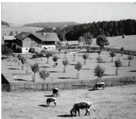
Viele landschaftsprägende Obstanlagen entstanden in der ersten Hälfte des 20. Jahrhunderts, hier bei Wipfling Obb., 1930.

Um die Interessen der Vereine besser vertreten zu können, wurde 1894 der Bayerische Landesverband für Obst- und Gartenbau ins Leben gerufen. Die Funktionäre des Landesverbands und der entstehenden Kreis- und Bezirksverbände bemühten sich, den Obstanbau auf allen Ebenen der staatlichen Verwaltung voranzubringen und förderten die Einstellung von gut ausgebildeten Baumwärtern. Bis heute bestehen zwischen dem Landesverband der Obst- und Gartenbauvereine und der Kreisfachberatung enge Verbindungen.