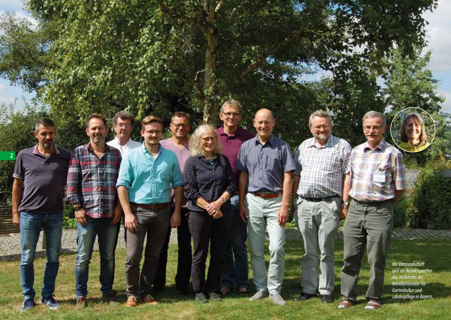
Die Vorstandschaft und die Bezirkssprecher des Verbandes der Kreisfachberater für Gartenkultur und Landespflege in Bayern.