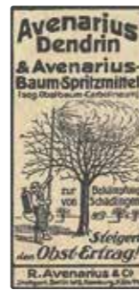
Nur zugelassene Pflanzenschutzmittel durften empfohlen und angewendet werden (Dienstanweisung 1948). Das lange Zeit übliche Winterspritzmittel Obstbaum-Karbolineum basiert auf Steinkohlenteer. Heute hätte es keine Chance mehr auf eine Genehmigung als Pflanzenschutzmittel (Anzeige aus: Wegweiser 30, 1922, Nr. 16, 125).