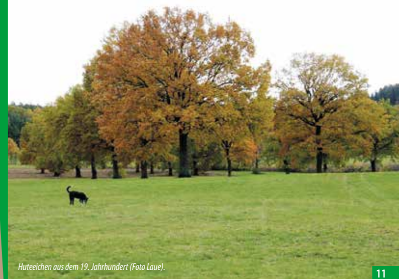
Huteeichen aus dem 19. Jahrhundert.

Felicia Laue, Dipl. Ing. Landespflege (FH), Kreisfachberaterin im Landkreis Roth